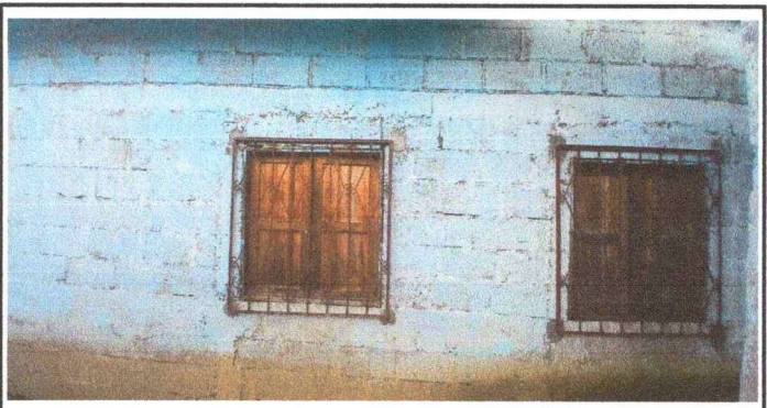
Foto 4: se observan ventanas en mal estado y pared expuesta a la humedad.