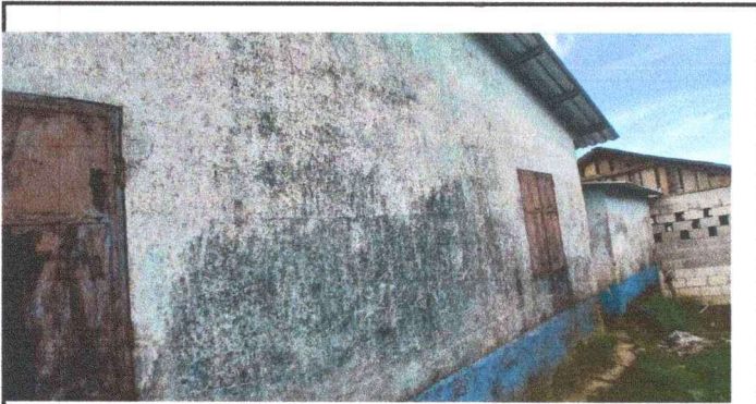
Foto 3: se observa el deterioro de la estructura portante y desprendimiento de pintura.